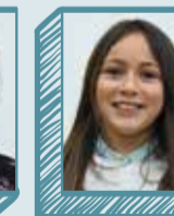
Emilie De Bettignies