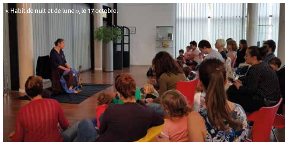
« Habit de nuit et de lune », le 17 octobre.