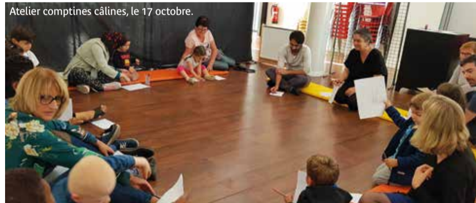
Atelier comptines câlines, le 17 octobre.