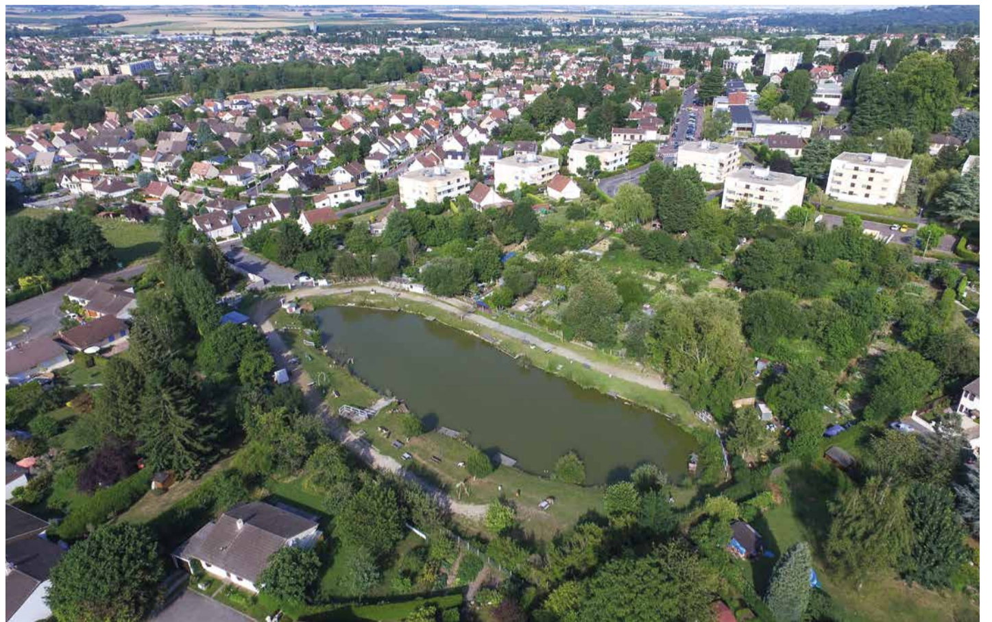
Prévenir les listes d'inondations en aménageant les sites sensibles, mieux protéger et valoriser les cours d'eau ou zones humides comme ici l'étang d'Ombreval : deux intentions louables fixées par la GEMAPI. Revers de la médaille : un mode de financement qui transfère la charge aux intercommunalités et la création d'une nouvelle taxe locale dont l'impact sera toutefois très limité, voire même bénéficiaire aux contribuables, grâce aux lourds investissements déjà réalisés par le SIAH du Croult et du Petit Rosne.

Concrètement, vous verrez apparaître sur votre prochaine feuille d'imposition locale une colonne GEMAPI et le montant de cette nouvelle taxe. Pour établir les contributions des habitants, la Communauté d'Agglomération s'est basée sur les besoins d'investissements exprimés par les deux grands syndicats intercommunaux qui interviennent sur le territoire, dont le SIAH qui a programmé 875 000 € d'investissements GEMAPI en 2018. En chiffre, on estime que cette contribution se situera aux alentours de 9 € par foyer fiscal, ce qui reste très modeste. Une taxe qui sera par ailleurs largement