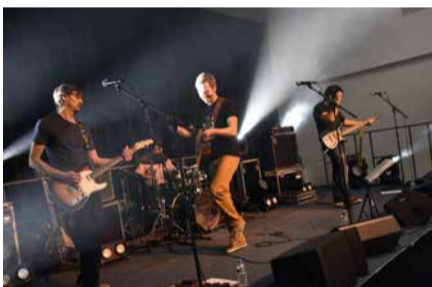
Le groupe No Fish No Rabbit a assuré la première partie du concert.