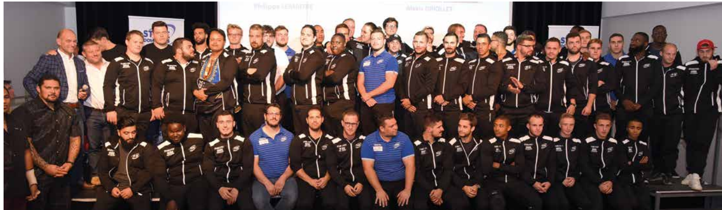
Les joueurs des équipes « première » et « réserve » réunis pour la traditionnelle photo de famille. Après une série de saison en demi-teinte, le Stade Domontois veut retrouver l'éclat des grandes années qui l'avaient porté aux portes de la ProD2 et réinvestir sur la formation des jeunes.