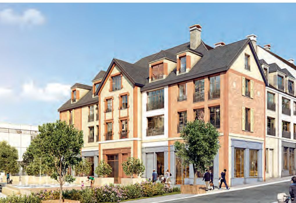
▲ Vue sur les futurs logements du « Cœur Citadin » depuis le milieu de la rue de la gare. On aperçoit à l'arrière-plan la façade de la médiathèque, l'ilot du Cœur citadin sera en effet traversé par un mail piétonnier agrémenté d'espaces verts qui ouvrira cette nouvelle et agréable perspective urbaine.

Une fois le réaménagement de la rue de la Gare achevé, la ville débutera les premiers travaux de réaménagement de la Place de la Gare.