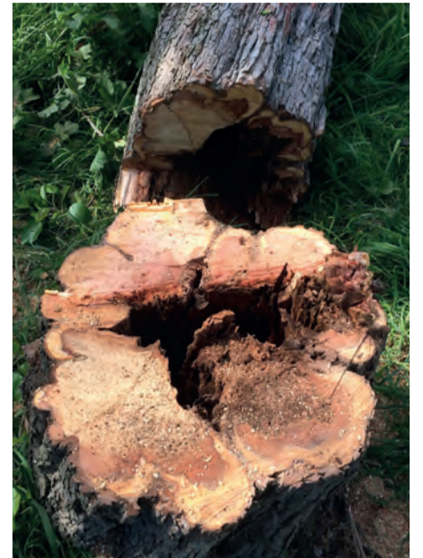
Abattage d'un poirier creux dans le parc des Coquelicots.

Au total sur l'année 2017, sont prévus 155 élagages et soins apportés aux arbres, ainsi