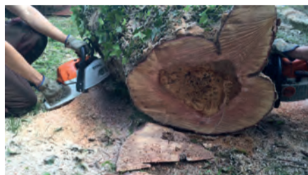
Abattage d'un saule tortueux commençant à se décomposer dans le jardin de la Maison de la petite enfance.