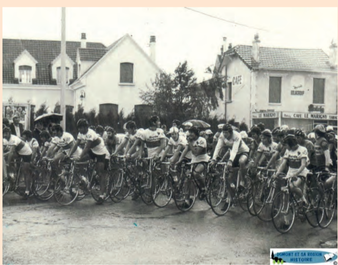
1979, carrefour des Quatres routes. Départ d'une course nocturne de l'US Domont cyclisme pour l'OMS

Si l'OMS a ralenti son activité et se retrouve « en petite veilleuse » comme il l'explique, c'est « parce que désormais les associations se considèrent comme "satisfaites" en salles, matériels et besoins, mais il faut continuer de s'investir. L'OMS crée un lien entre les dirigeants sportifs. Et il y a toujours un intérêt à ce que la Ville participe et donne de l'énergie ! ».