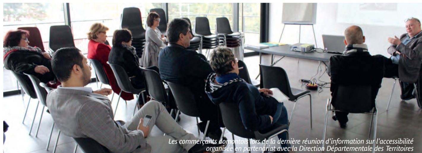
Les commerçants domontois lors de la dernière réunion d'information sur l'accessibilité organisée en partenariat avec la Direction Départementale des Territoires