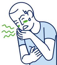
Vertiges / Nausées