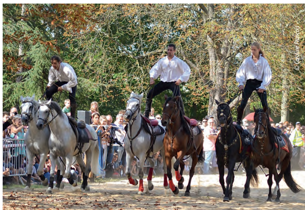
La poste hongroise : trois jolies paires de chevaux ibériques