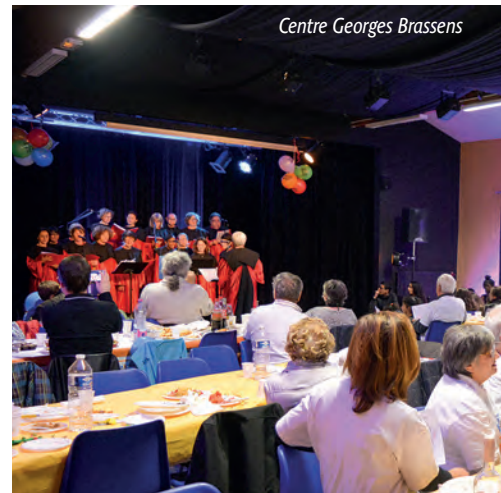
Centre Georges Brassens