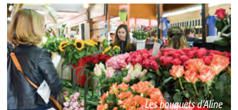
Les bouquets d'Aline