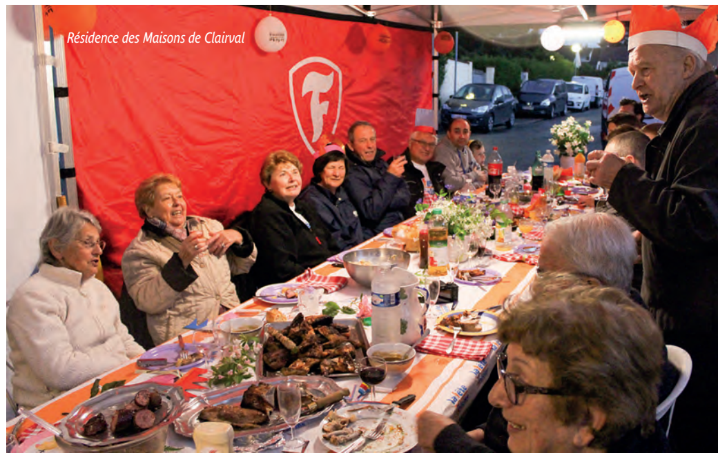
Résidence des Maisons de Clairval