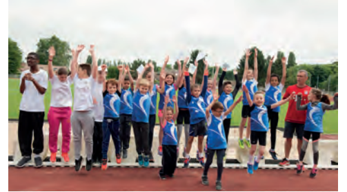
Présentation des athlètes de Domont enrichis des crocus blancs