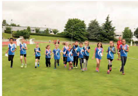
L'équipe de Domont lors de l'échauffement