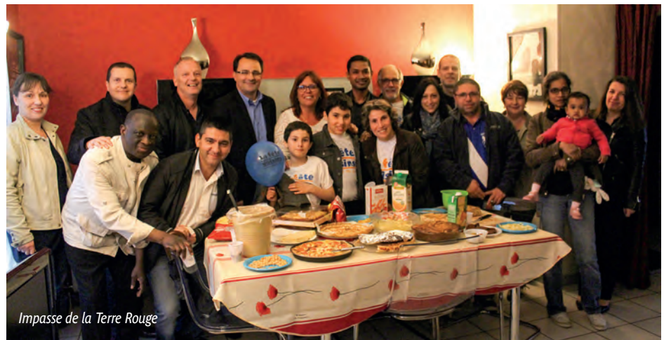
Impasse de la Terre Rouge