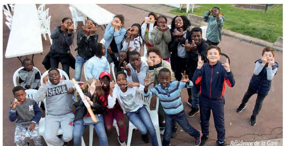
Résidence de la Gare