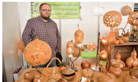
Objets en gourdes calabasses de Nicolas Delannoy