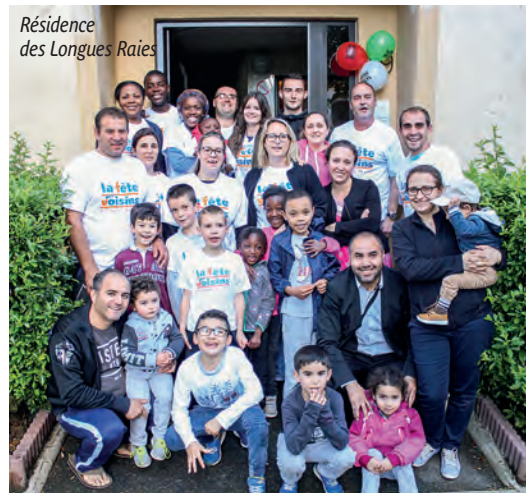
Résidence des Longues Raies