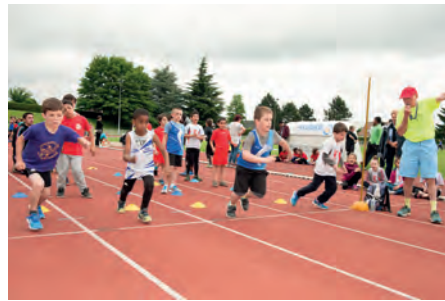
Départ de la course des 1000 mètres