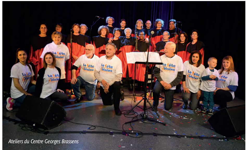
Ateliers du Centre Georges Brassens