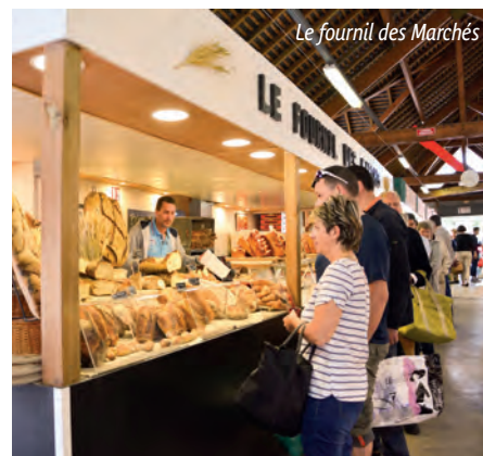
Le fournil des Marchés