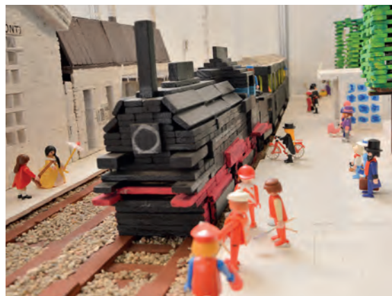
Maquette de la place de la gare en briquettes de bois des enfants de l'accueil de loisirs Jean Moulin