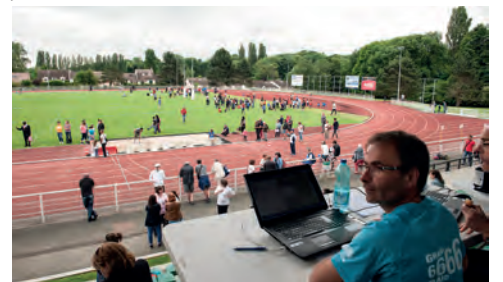
Vue du centre informatique des sportifs et des installations