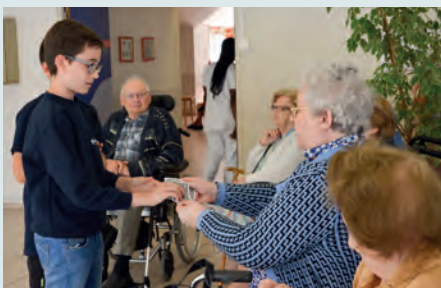
Tour de magie intergénérationnel