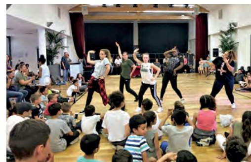
Les Domontoises du groupe Ladies House