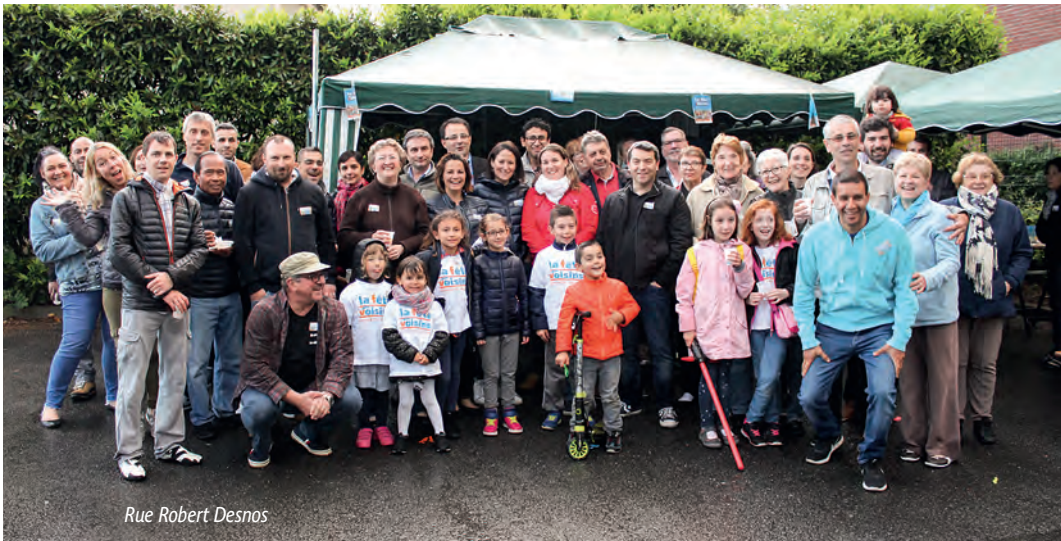
Rue Robert Desnos