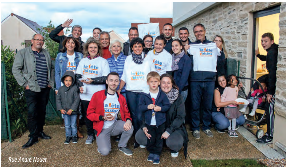
Rue André Nouet