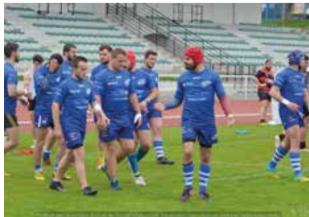
Le match qui a fait vibrer les dirigeants et supporters du Stade Domontois. La victoire face à Compiègne, poids lourd du championnat, en début de saison. D'autres belles et symboliques victoires ont ensuite émaillé la saison, face à des équipes telles qu'Évreux et Houilles, solides prétendants à la montée en fédérale 2.

Selon la formule consacrée, l'essai de la refondation a été marqué cette saison, reste à le transformer dès la reprise du