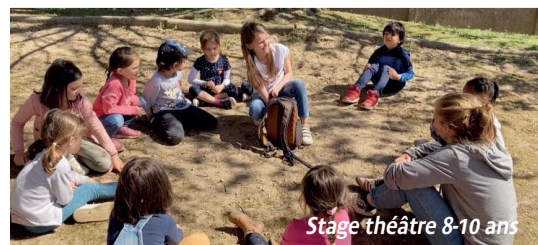
Stage théâtre 8-10 ans