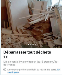
Débarrasser tout déchets 1€ Mis en vente il y a environ un jour à Domont, Ile-de-France Le vendeur préfère un dépôt ou retrait à la porte. En savoir plus