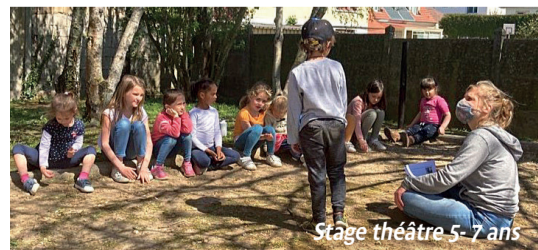
Stage théâtre 5-7 ans