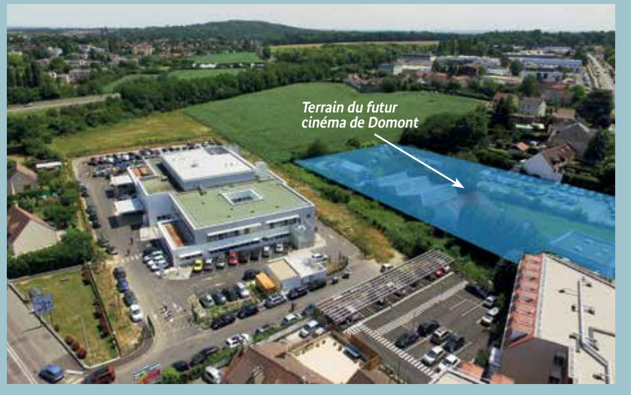
Terrain du futur cinéma de Domont

D'ici là, le cinéma de Domont restera dans ses murs, en totale sécurité.