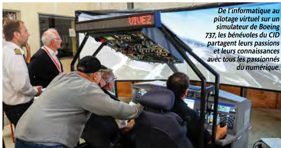
De l'informatique au pilotage virtuel sur un simulateur de Boeing 737, les bénévoles du CID partagent leurs passions et leurs connaissances avec tous les passionnés du numérique.

1982-2022 : le Club Informatique Domontois fête cette année son quarantième anniversaire. Toute une histoire : celle des technologies numériques et un fil conducteur, la convivialité et la bonne humeur.