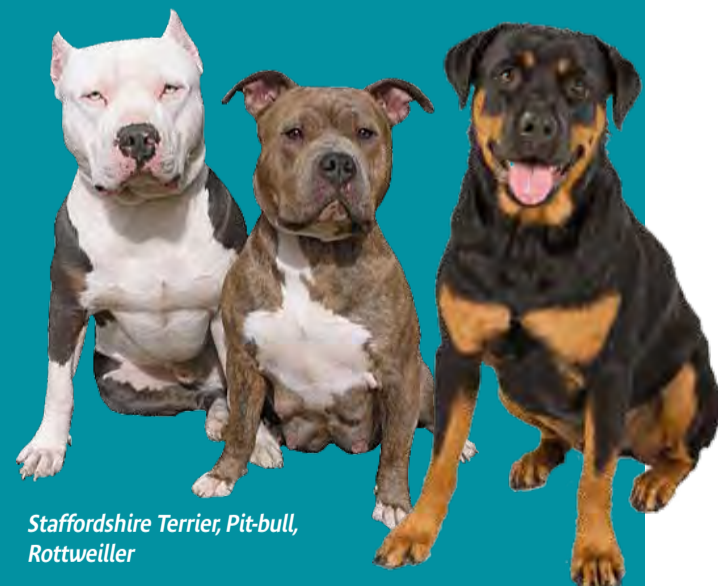
Staffordshire Terrier, Pit-bull, Rottweiler

Attention : la détention de chiens de 1 re ou 2 e catégorie est interdite aux mineurs, aux personnes majeures sous tutelle (sauf autorisation par le juge des tutelles), aux personnes condamnées (pour crime ou peine d'emprisonnement pour délit inscrit au bulletin n° 2 du casier judiciaire) et aux personnes auxquelles la propriété ou la garde d'un chien a été retirée. La détention d'un chien dangereux par une personne non autorisée est punie d'une peine de 6 mois d'emprisonnement et de 7500 € d'amende.